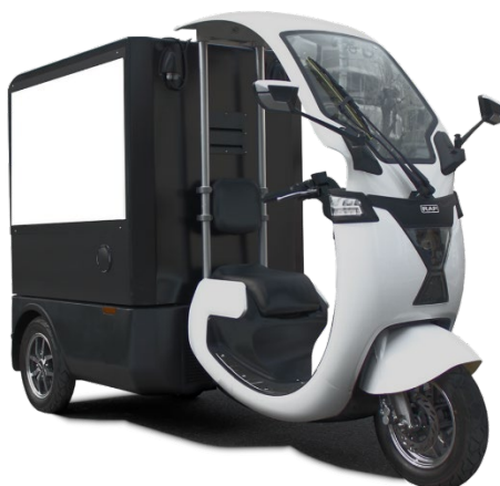
ディスプレイ搭載 EV スクーター「ScootVision」

ミナトホールディングス株式会社(本社:東京都港区、代表取締役会長兼グループCEO:若山健彦、証券コード:6862)のグループ会社であるミナト・フィナンシャル・パートナーズ株式会社(以下 MFP)は、本年2月12日から株式会社 TechVoice(以下 TechVoice)が企画・販売・運営するディスプレイ搭載 EV スクーター「ScootVision」の運用を本格的に開始します。