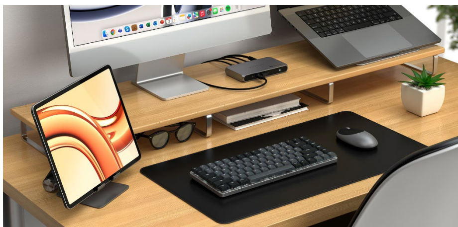
PC・モバイルデバイス周辺機器「 サテチ Satechi」